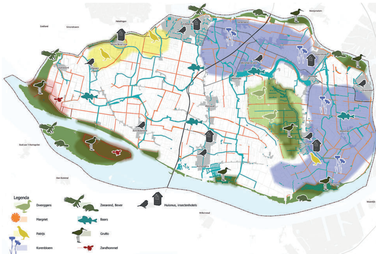
Figuur 1. Impressie (op hoofdlijnen) van habitat en biotopen in de Hoeksche Waard (bureau Strooming)