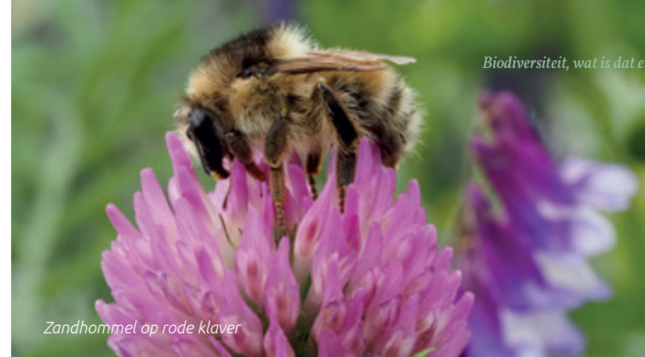
Zandhommel op rode klaver

Op die manier maken ziektes minder kans en zijn ecosystemen beter bestand tegen een stootje of een korte verstoring. Daarbij staat in de natuur alles met elkaar in verbinding. Als 1 soort te sterk wordt of juist uit een gebied verdwijnt, heeft dat gevolgen voor heel veel andere soorten.